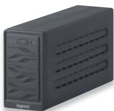
3 100 02