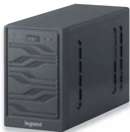
3 100 13